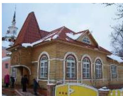
Почта Деда Мороза

В рамках реализации проекта «Великий Устюг – родина Деда Мороза» осуществлена работа по формированию единого комплекса имущества на территории вотчины Деда Мороза, так в собственность области: